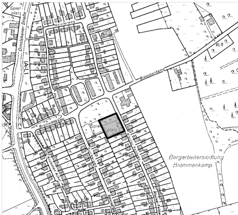
Abb.: Geltungsbereich der 57. Flächennutzungsplanänderung