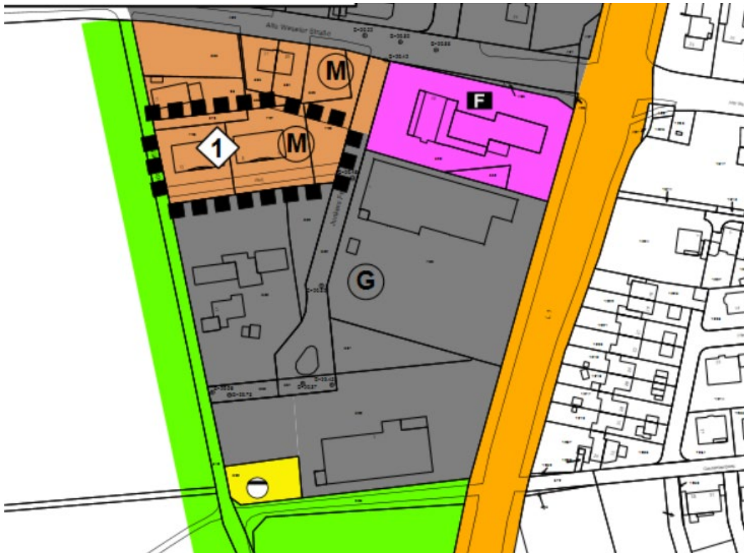
Abb.: Geltungsbereich der erneuten 49. Flächennutzungsplanänderung Ortsteil Hünxe in der Gemarkung Hünxe, Flur 5

Die Planbereichsgrenzen der oben genannten Bauleitplanänderung können der nachfolgenden Planskizze entnommen werden: